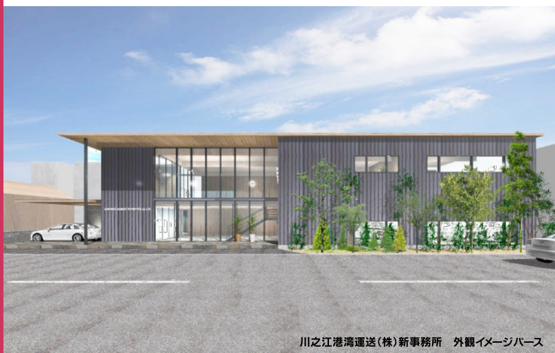
川之江港湾運送(株)新事務所 外観イメージパース