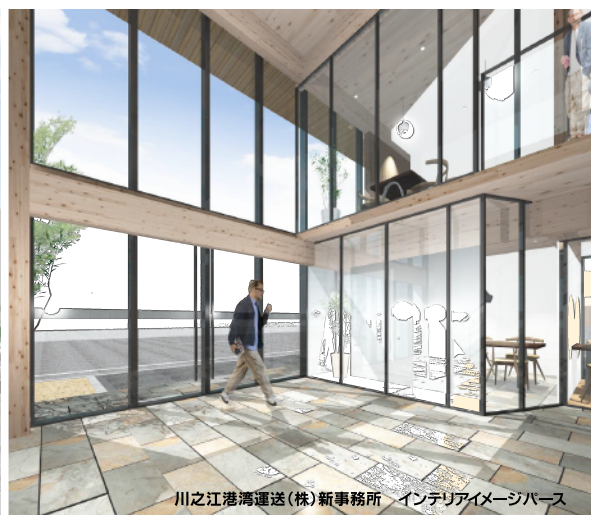
川之江港湾運送(株)新事務所 インテリアイメージパース